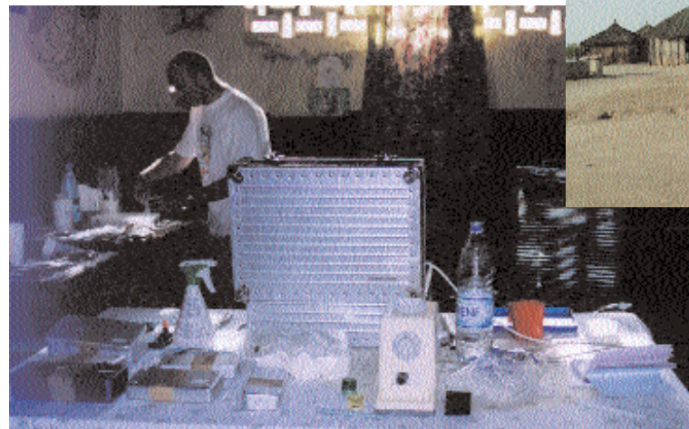
Souvent dans des locaux précaires, au mieux dans un dispensaire, la salle de soins s'improvise.